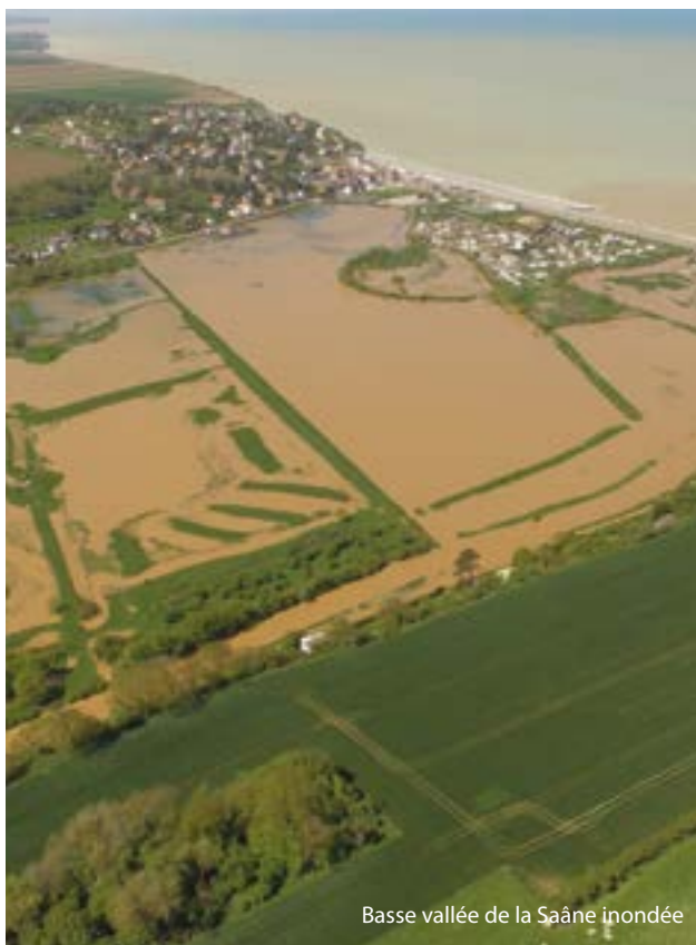
Basse vallée de la Saône inondée

En 2019, le projet Interreg PACCo (Promouvoir l'Adaptation aux Changements Côtiers – Promoting Adaptation to Changing Coast) associant la vallée de la Saône et la vallée de l'Otter (Angleterre) a été retenu par le comité de sélection de l'Interreg France Manche Angleterre, déclenchant ainsi une aide financière importante de l'Union Européenne, soit plus de 18 millions d'euros investis sur le territoire.